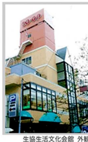
生協生活文化会館 外観