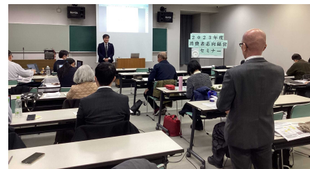
前回のセミナーの様子