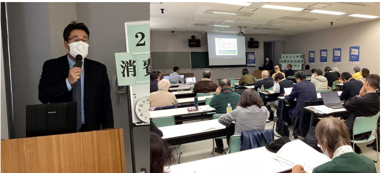
講演① 「消費者志向経営とは」