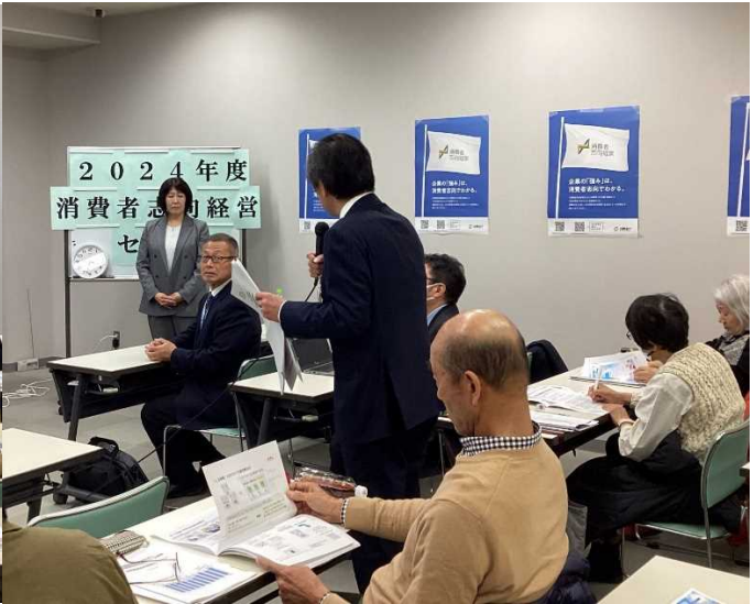
講演後の質疑応答のようす