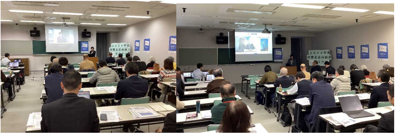
セミナー会場全体の様子